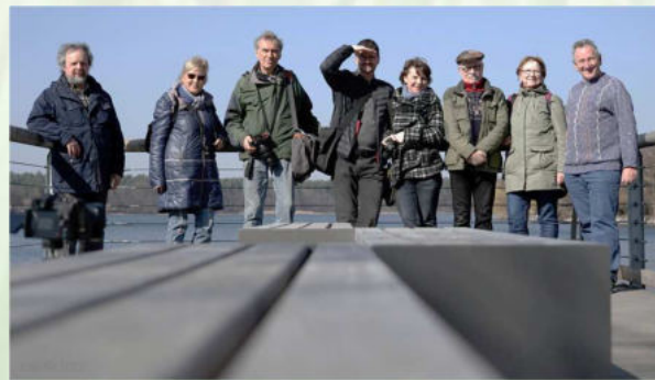
Bei einem Fotoausflug